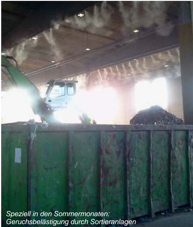
Speziell in den Sommermonaten: Geruchsbelastung durch Sortieranlagen

Unabhängig ob die üblen Gerüche von Containern, Pressen, Hausmüllwagen oder Sortieranlagen kommen, sind die Geruchsbelastungen in den Sommermonaten besonders stark.