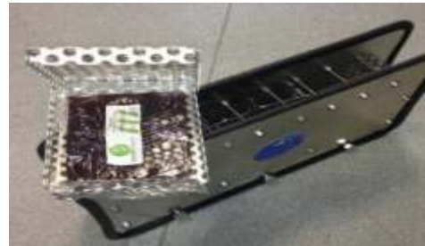
Halterung Typ AirNeutral Outdoor

Selbst Freiflächen und Außenanlagen lassen sich sehr leicht durch unsere Polymerplatten mit den BDLC 501 Wirkstoffen hinsichtlich der Geruchsintensität neutralisieren.