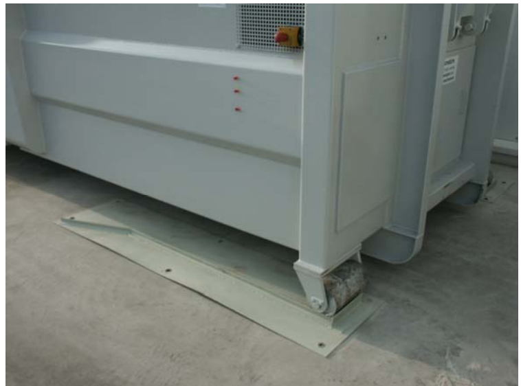
Zentrierschienen für RIES Sperrmüllpacker SP 320 für Abrollkipper