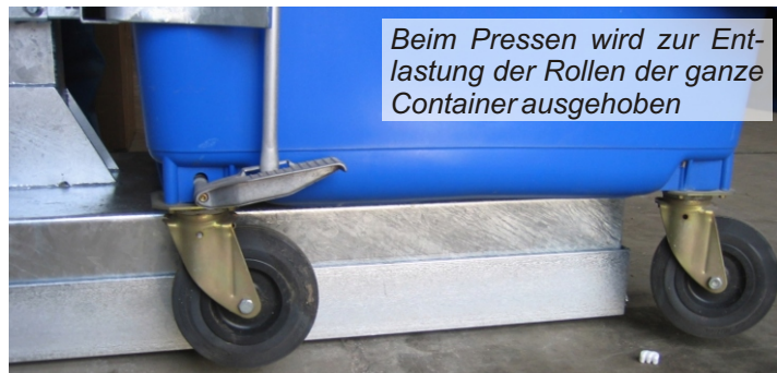
Beim Pressen wird zur Entlastung der Rollen der ganze Container ausgehoben